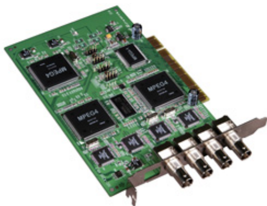
Шина PCI Количество каналов видео

Все платы серии IVC позволяют оцифровывать сигналы от стандартных аналоговых видео камер NTSC/PAL и преобразовывать их в известные цифровые форматы MPEG 1, 2, 4 для дальнейшей обработки или хранения. Количество подключаемых одновременно к одной плате камер может варьироваться от 4 до 16. В одном компьютере может быть установлено до 4 таких плат, что особенно удобно для создания охранных видео систем.